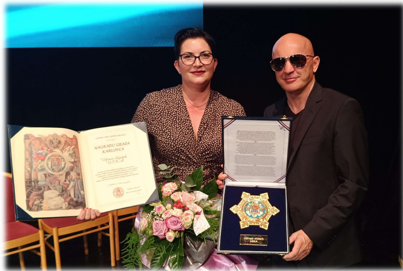
Nagrada Grada Karlovca dodijeljena Udruzi slijepih USKA 2024.g.

Javna priznanja dodjeljuju se pravnim i fizičkim osobama, udrugama, klubovima, organizacijama i zajednicama, te njihovim organizacijskim dijelovima, za njihova djelovanja kojima su pridonijeli razvoju, boljitku ili promociji Grada Karlovca ili njegovih pojedinih djelatnosti.