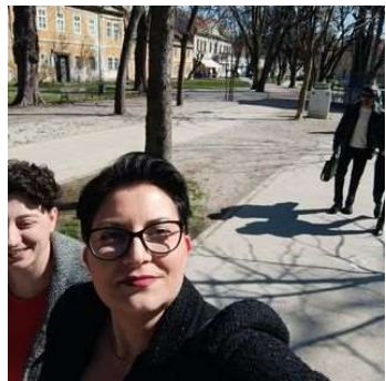
Pripremila: Romija Radočaj Naglič