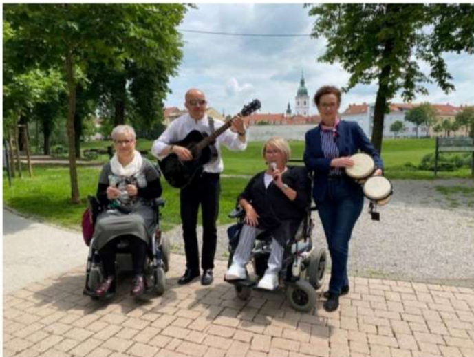
Glazbeni sastav osoba s invaliditetom „Sjaj u tami“