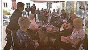
DRUŽENJE U SKLOPU PROJEKTA "ČITAM DAKLE POSTOJIM"

Kralja Tomislava 9 47 000 Karlovac Internetna stranica: www.uska.hr E-mail: udrugauska@gmail.com