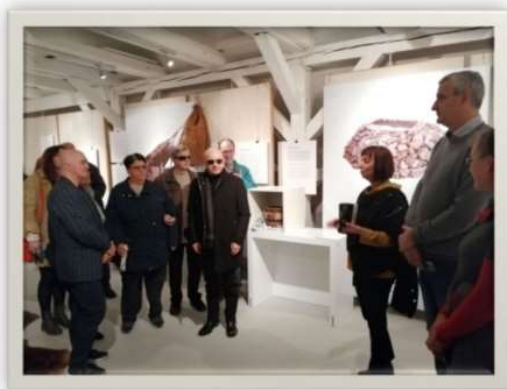
Korisnici na izložbi „Prapovijest u rukama“