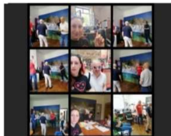
Asistencija u sportsko rekreativnoj aktivnosti pikado za osobe s oštećenjem vida.

Usluga videćeg pratitelja obuhvaća aktivnosti: Prijevoza, pratnje i pomoći u različitim socijalnim aktivnostima ( odlazak liječniku, stomatologu, u ljekarnu, trgovinu, poštu, banku, Centar za socijalnu skrb, kulturno-zabavne institucije, općine, matični ureda, itd., ovisno o potrebi slijepce osobe ), obuku za obavljanje kućanskih poslova, pomoć pri obavljanju administrativnih poslova slijepim osobama koje žive same, čitanje dokumentata.