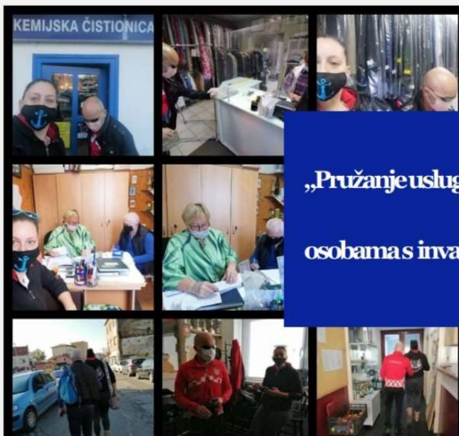
Videća pratiteljica Udruge slijepih USKA s korisnicima u pružanju usluge prijevoza, pratnje i asistencije u svakodnevnom životu

„Pružanje usluge videćeg pratitelja osobama s invaliditetom“ 2020.g.