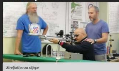
Streljaštvo za slijepe

Pikado, kuglanje, streljaštvo, borilačke vještine i fitness za osobe s oštećenjem vida.