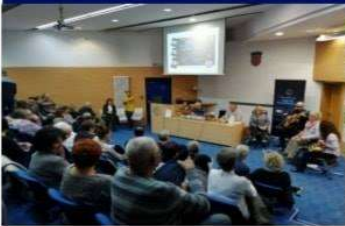
ČITATELJSKI KLUB ZOLA