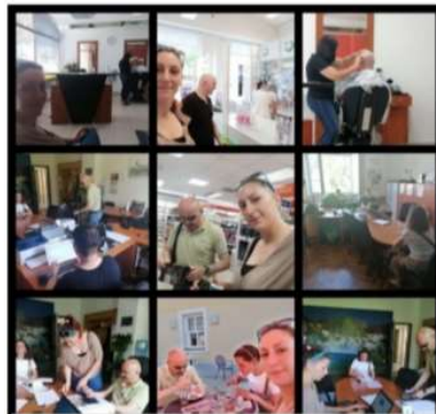
Rad s korisnicima

Kako bi osoba mogla koristiti uslugu videćeg pratitelja potrebno je iskazati potrebu i dostaviti rješenje o postotku tjelesnog oštećenja i presliku osobne iskaznice te ugovoriti termin, pri čemu prednost uvijek imaju liječnički pregledi. Kontaktirati možete koordinatora videćeg pratitelja Udruge slijepih USKA putem telefona, nazvati Udruhu slijepih USKA na broj 047/412-616, putem maila na udruganska@uska.hr ili putem društvenih mreža, tj. službenih profila Udruge slijepih USKA na društvenim mrežama Facebook i Twitter, poveznice na iste možete pronaći i na web stranicama udruge www.uska.hr