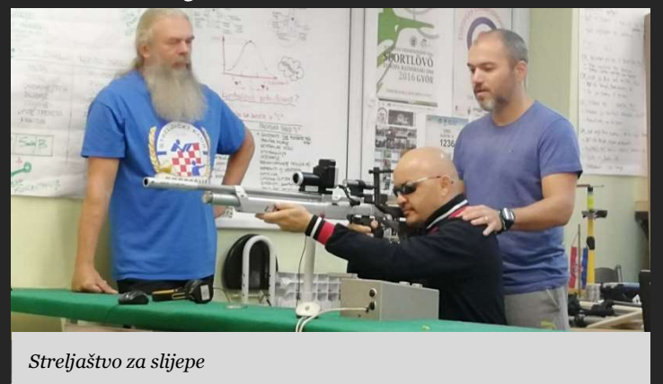
Streljaštvo za slijepe

Pikado, kuglanje, streljaštvo, borilačke vještine i fitness za osobe s oštećenjem vida.