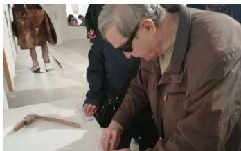
Izložba „Prapovijest u rukama“

Pružanjem same usluge se unapređuje kvaliteta života slijepih osobama na način da im omogućuje samostalnost, potiče ih da žive aktivnije i uključe se u različite sfere društvenog života.