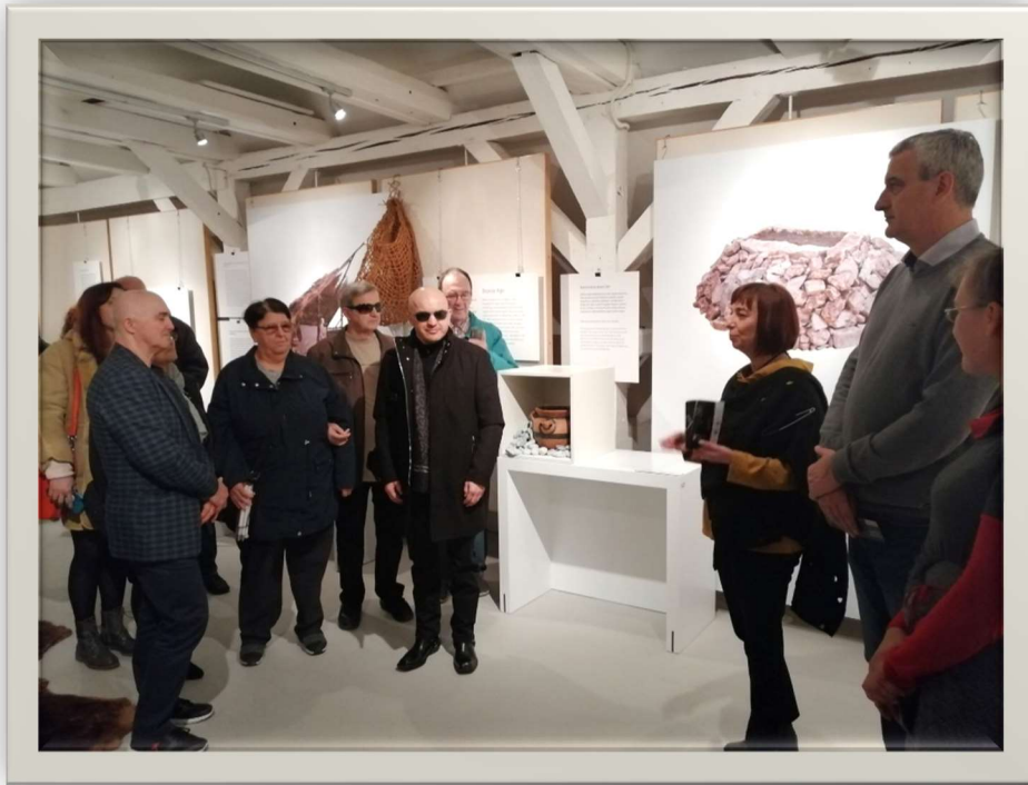
Korisnici na izložbi „Prapovijest u rukama“