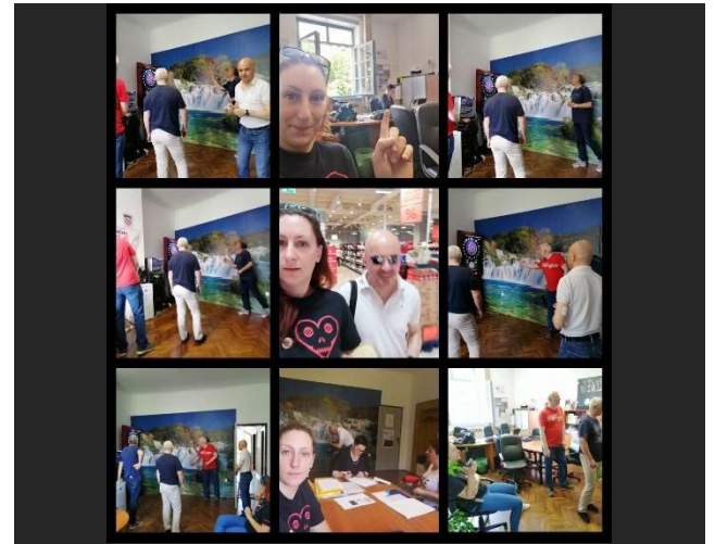
Asistencija u sportsko rekreativnoj aktivnosti pikado za osobe s oštećenjem vida.

Usluga videćeg pratitelja obuhvaća aktivnosti: Prijevoza, pratnje i pomoći u različitim socijalnim aktivnostima ( odlazak liječniku, stomatologu, u ljekarnu, trgovinu, poštu, banku, Centar za socijalnu skrb, kulturno-zabavne institucije, općine, matični ureda, itd., ovisno o potrebi slijepe osobe ), obuku za obavljanje kućanskih poslova, pomoć pri obavljanju administrativnih poslova slijepim osobama koje žive same, čitanje dokumenata.