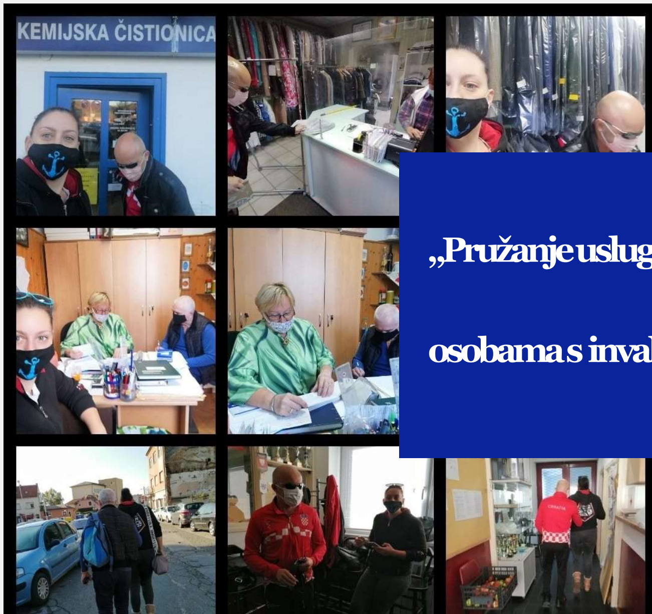
Videća pratiteljica Udruge slijepih USKA s korisnicima u pružanju usluge prijevoza, pratnje i asistencije u svakodnevnom življenju

„Pružanje usluge videćeg pratitelja osobama s invaliditetom“ 2020.g.