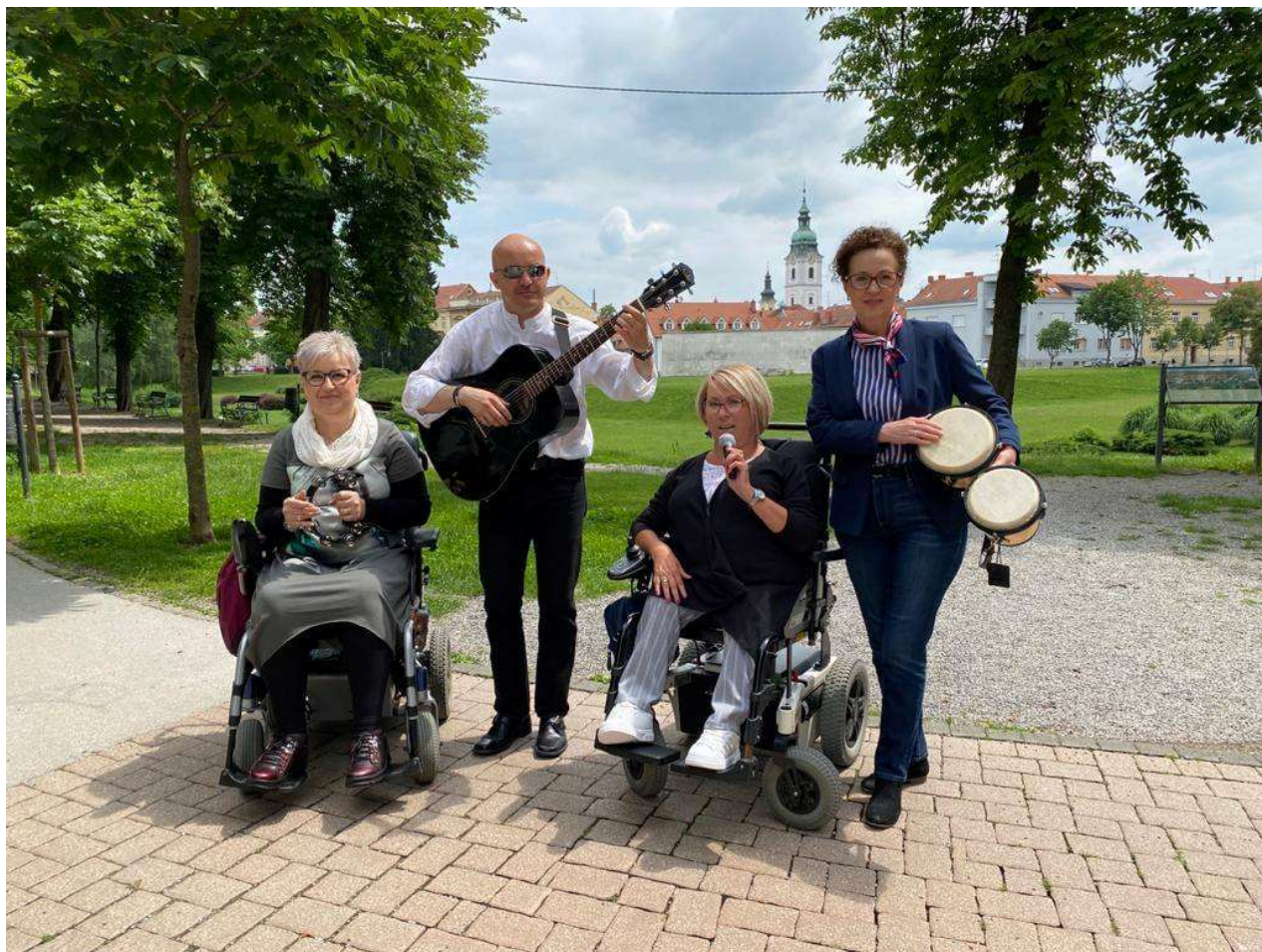
Glazbeni sastav osoba s invaliditetom „Sjaj u tami“